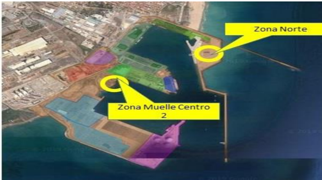
Plano de Gandía