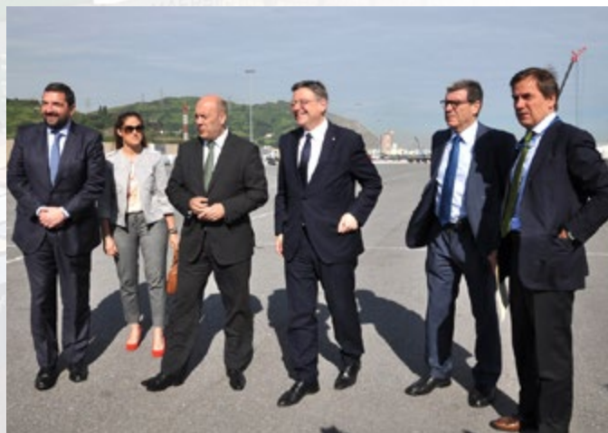
La delegació valenciana va visitar el Port de Bilbao.