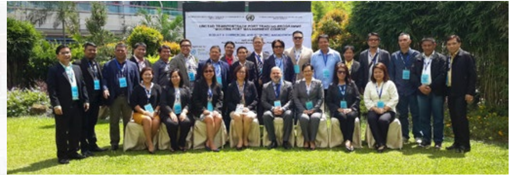
24 representants de les comunitats portuàries de Filipines van assistir al curs en què va participar l'APV.