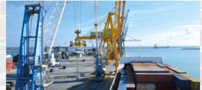
La pantalla se ubicará en el muelle Noreste en el extremo este de la terminal intermodal de InterSagunto Terminales.

El barco atracó en Valencia con 1.400 personas a bordo, entre pasaje y tripulación, y regresará a Valencia el próximo mes de octubre. En total, durante esta temporada los cruceros de la compañía Thomson tienen previstas 11 escalas en el recinto valenciano, cuatro a cargo del citado "Thomson Celebration".