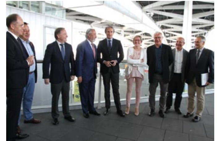
El ministre de la Serna amb els membres de la Sociedad Parque Central.

Aquest cost serà assumit pel propi Ministeri de Foment, i inclou des de l'actualització de l'estudi informatiu, fins a l'execució completa.