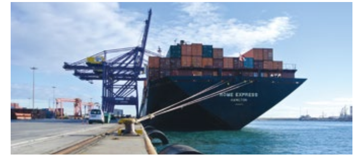
Un dels bucs de Hapag-Lloyd atracat en les instal·lacions de APMT València.