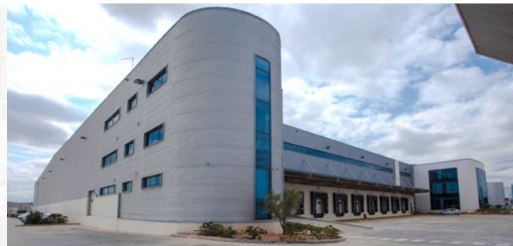
Son en total más de 43.000 metros cuadrados ubicados en seis plataformas de Valencia, Onteniente, Madrid y Barcelona.

En la actualidad el depósito tiene capacidad para atender 400 camiones al día (aunque puede triplicar la cifra en caso de necesidad). La puesta en marcha del depósito ha supuesto una inversión cercana a los tres millones de euros y en él trabajan 18 personas. El compromiso de movimiento con la APV en esta concesión es de 24.000 unidades el primer año y en torno a las 48.000 las siete años restantes.