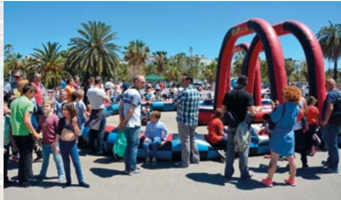
El lunes se desarrollaron múltiples actividades dirigidas a toda la familia.