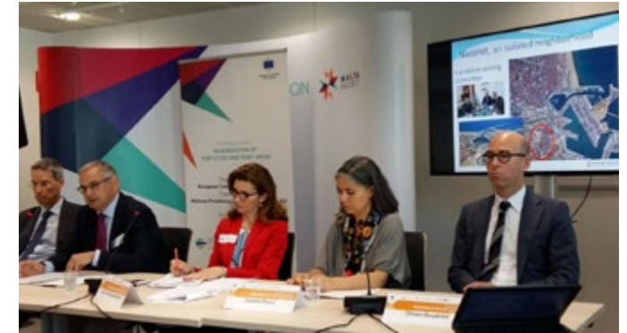
El secretari autonòmic d'Habitatge, Obres Públiques i Vertebració del Territori, en un momento de la seua intervenció.