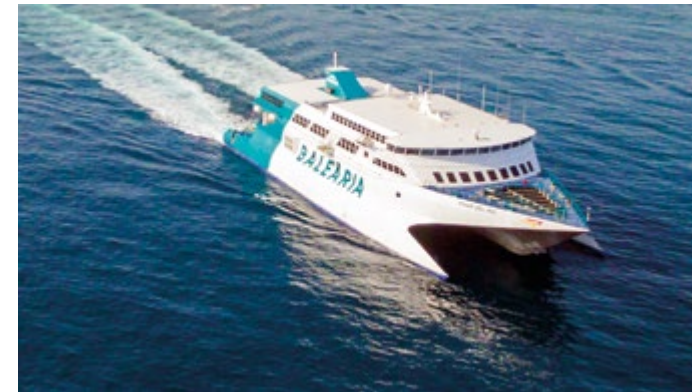
El servici serà operat pel buc d'alta velocitat "Pinar del Río".

La recaptació de la jornada se sumarà a l'aportació voluntària dels estibadores a través del jornal solidari.