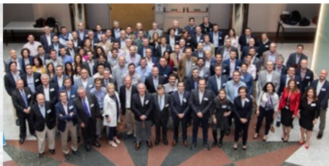
El Grupo Romeu ha reunido a sus principales directivos, un total de más de 100 profesionales de 20 países.