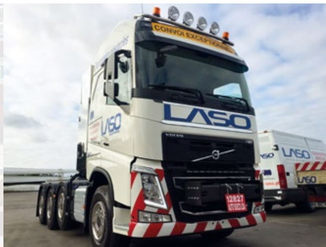
LASO es una empresa de transporte terrestre líder en Portugal especializada en mercancías de dimensiones especiales.

La sociedad facturó en 2016 por encima de los 450 millones de euros, empleando a más de 1.600 trabajadores en 23 países.