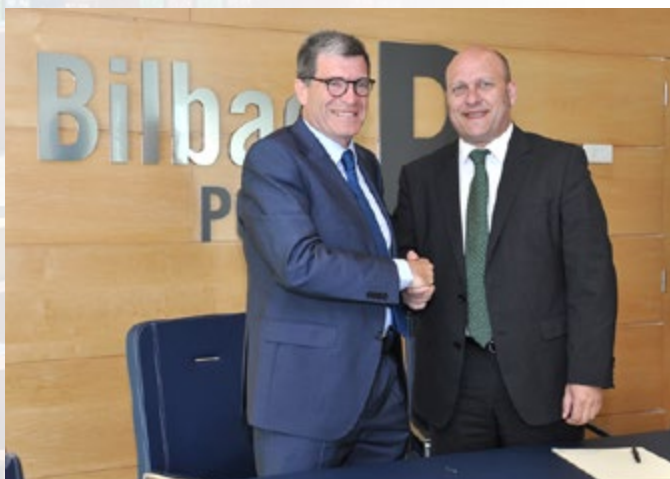
Los presidentes de las APs firmaron un protocolo de actuación.