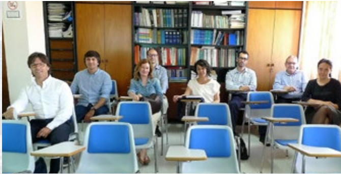
El curs es va impartir del 15 al 18 de maig, de 16 a 20 hores, en la seu d'ATEIA-OLTRA València.