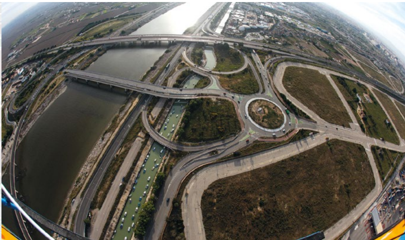
La Zona de Actividades Logísticas de Valencia podría iniciar en breve su recta final.

El Plan Especial de la ZAL, documento necesario para tramitar el proyecto, fue presentado en Conselleria el 30 de mayo.