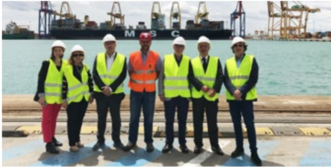
Miembros de la Junta Directiva de AVEP durante su visita a las instalaciones de MSCTV en el puerto de Valencia.