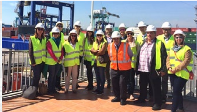
Representantes de empresas del sector químico pertenecientes a QUIMACOVA durante su visita a APM Terminals Valencia.