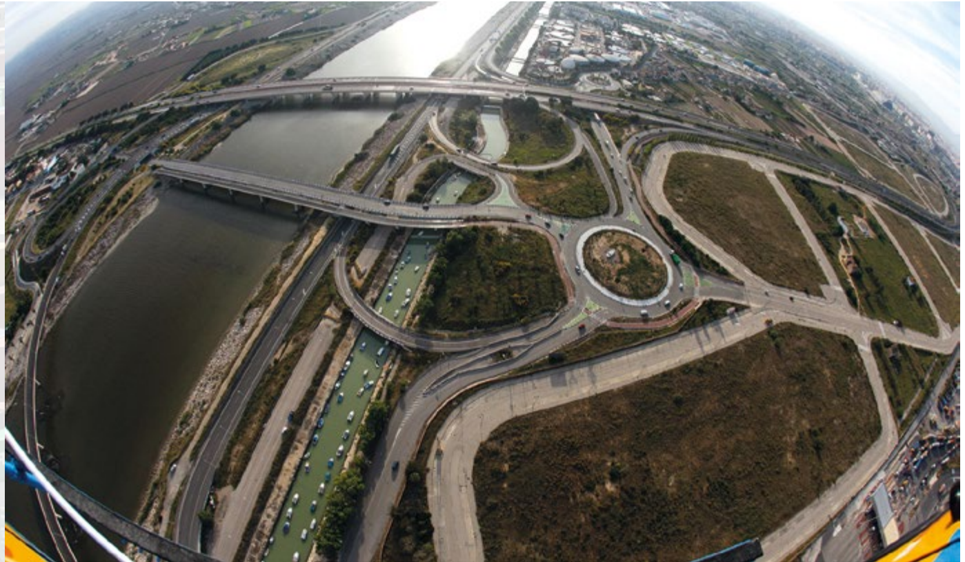
La Zona d'Activitats Logístiques de València podria iniciar en breu la seua recta final.

El Pla Especial de la ZAL, document necessari per a tramitar el projecte, està ja pràcticament finalitzat.