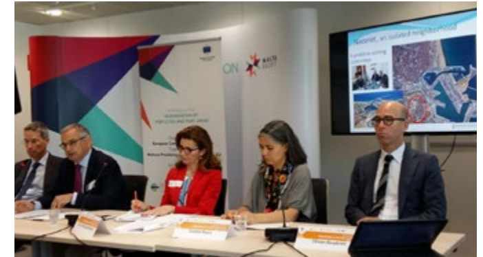
El secretario autonómico de Vivienda, Obras Públicas y Vertebración del Territorio, Josep Vicent Boira, en un momento de su intervención.

En su intervención, Boira defendió la relación que ha de existir entre los puertos y las ciudades portuarias para avanzar en el desarrollo económico de la Comunitat. Boira definió el puerto de València como "uno de los mayores del Mediterráneo y de Europa, con incremento de tráfico muy importante. Ha pasado a ser un hub logístico, donde las rutas asiáticas, africanas y europeas se entrecruzan. El tráfico continuado de mercancías entre las distintas comunidades y Europa ha provocado que sea el territorio con mayores movimientos del país tanto en camión como como ferroviario en su conexión con el interior del país".