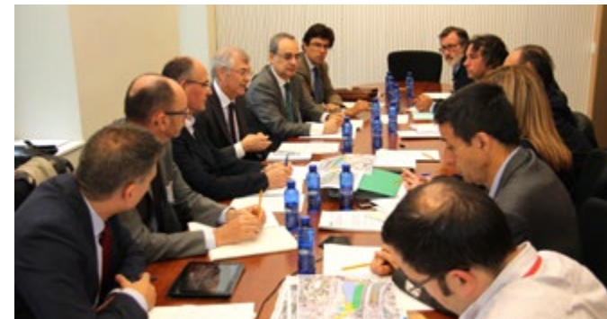
La comissió tècnica està formada per representants de la Conselleria, Foment, Adif, Autoritat Portuària, Ajuntament, Puertos del Estado i EIGE.