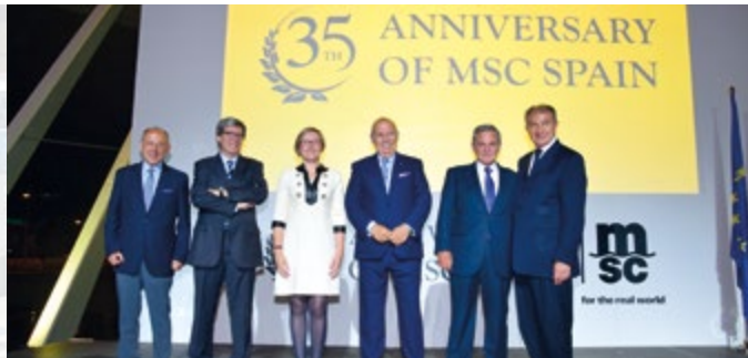
Els directius de MSC España junt a les autoritats que assistiren al esdeveniment.