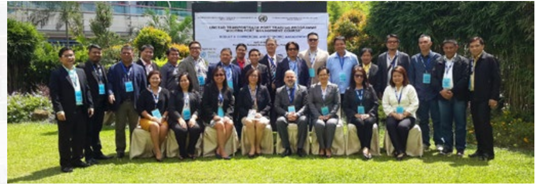
24 representantes de las comunidades portuarias de Filipinas asistieron al curso en el que participó la APV.