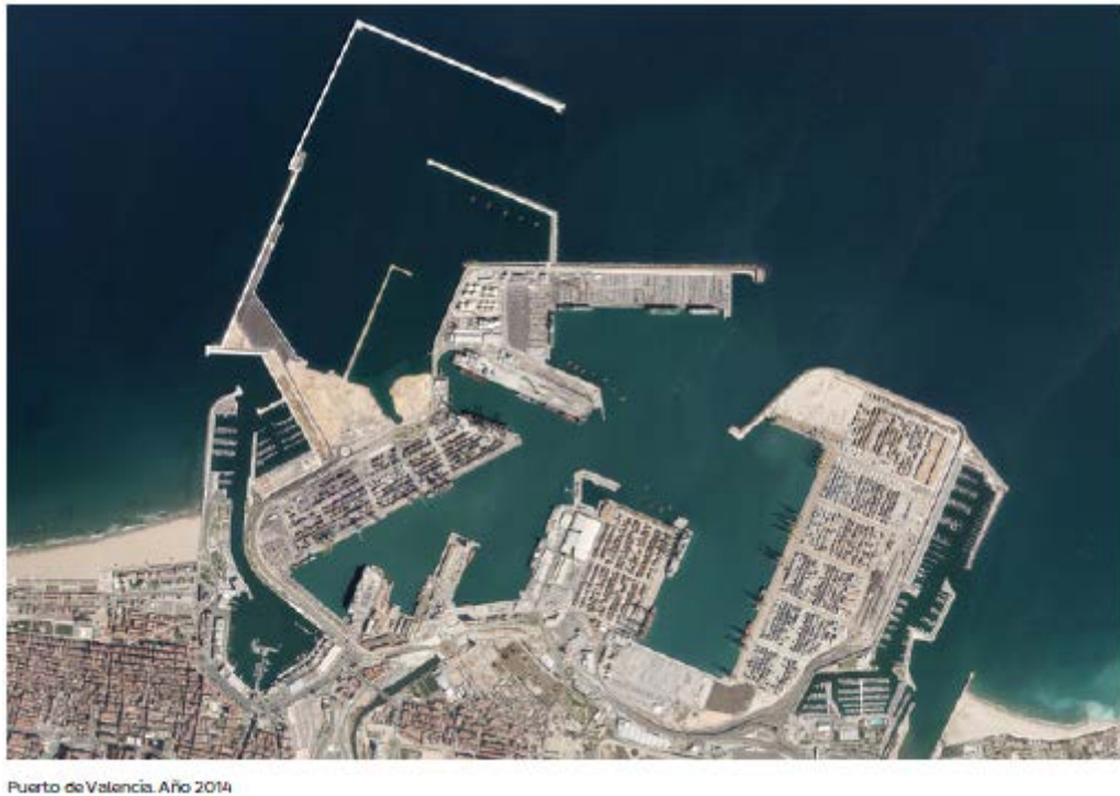
Figura nº 1: Puerto de Valencia; Fuente: APV - Puerto de Valencia (2015)